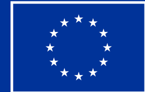
Euroopan unionin rahoittama

Jos käytettävissä on vain yksi Pantone-väri (tässä esimerkissä on käytetty väriä Reflex Blue).