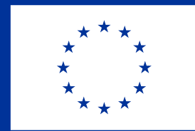
Euroopan unionin rahoittama