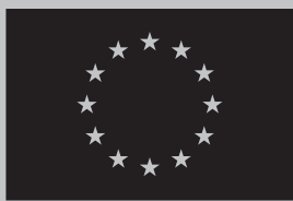
Euroopan unionin rahoittama

Jos käytettävissä on vain musta tai valkoinen.