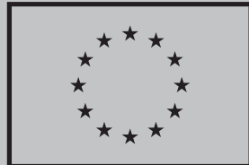
Euroopan unionin rahoittama