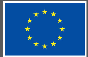
Euroopan unionin osarahoittama