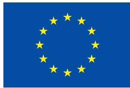
Euroopan unionin osarahoittama