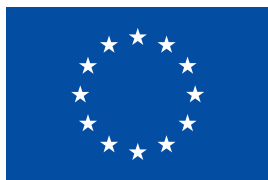
Euroopan unionin rahoittama

Jos käytettävissä on vain yksi Pantone-väri (tässä esimerkissä on käytetty väriä Reflex Blue).